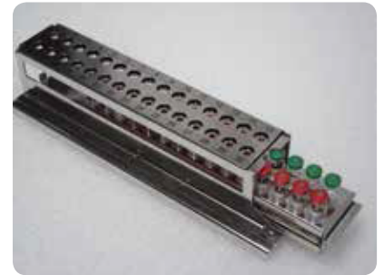
Штатив для ручной инокуляции флаконов Кат. номер SI 190815