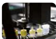
ДОЗИРОВАНИЕ ПРОБ В АНАЛИЗАТОРЕ ALFRED 60