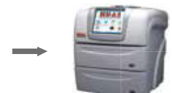
ПРОДОЛЖЕНИЕ АНАЛИЗА в HB&L

HB&L - Технические характеристики Напряжение: 230 В ± 10% или 115 В ± 10% Потребляемая мощность: макс 750 ВА