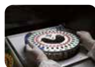
ПЕРЕНОС ВРУЧНУЮ ФЛАКОНОВ посредством специального приспособления из ALFRED 60 в HB&L